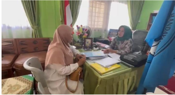
Gambar 4. Survey awal Tim Pengabdian dengan Kepala Sekolah

masyarakat setempat, pemasaran dan data lainnya.