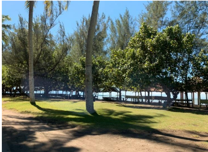
Gambar 1. Pondok-Pondok di Sepanjang Pesisir Pantai

Padang, salah satunya adalah Pengembangan Kampung Nelayan Bestari di Kelurahan Pasie Nan Tigo Kecamatan Koto Tangah Kota Padang didapatkan data bahwa belum maksimalnya pemberdayaan masyarakat di sekitar kelurahan dan belum adanya tanda pengenal yang menjadi ciri khas wilayah kampung tematik di Pasie Nan Tigo ini. Disepanjang pasir pantai yang indah belum terdapat tempat sampah yang terpilah, fasilitas umum yang belum memadai disepanjang pasir seperti mushola dan MCK yang membuat kesulitan wisatawan yang ingin mengunjungi daerah Kampung Nelayan Bestari ini.