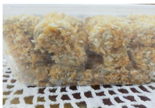
Gambar 5. Hasil Diversifikasi Olahan Ikan Menjadi Bakso dan Nugget Ikan