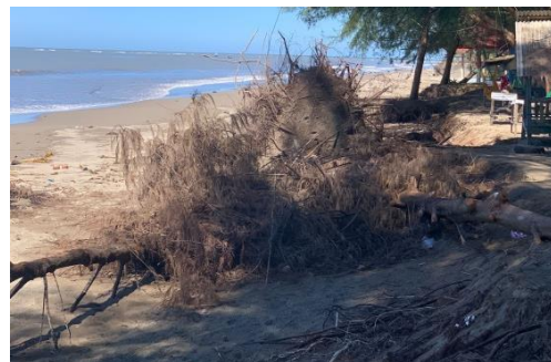
Gambar 3. Kondisi Sampah di Kampung Nelayan Bestari