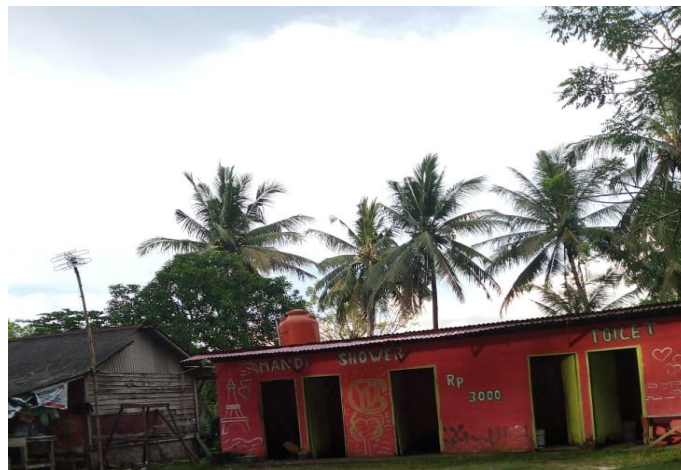
Gambar 2. Kondisi Toilet Umum di Kampung Nelayan Bestari

Lokasi Kampung Nelayan Bestari ini lebih kurang 13 km dari Kantor Walikota Padang dan 12 km dari perguruan tinggi pengabdian. Berdasarkan hasil observasi dan wawancara pengabdian dengan pihak Kelurahan dan masyarakat Kampung Nelayan Bestari, permasalahan mitra yang terdapat disana adalah: