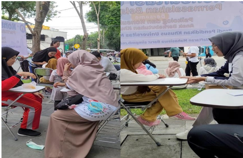
Gambar 2. Kegiatan Pelaksanaan Layanan Konsultasi di Acara Car Free Day Kota Padang